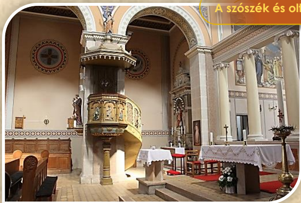
A szószék és oltár

A szentély előtti függőleges falon látható két angyal, Újvári Lajos festőművész alkotása. A mellékhajókat vaskos oszlopok tagolják, melyeken szentek szobrai láthatók. A mellékhajók végén két kis oltár van. A kóruson hatalmas orgona található.