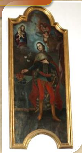
Szent Imre herceg