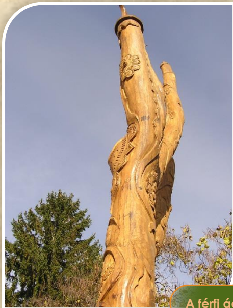
A férfi ág

A döbröközi Életfa egy, a környékbeli erdőben növekedett tölgyfából lett kifaragva. Az alján körbefutó hullámvonal és stilizált halfigurák a Kapos folyót, a vizet, a halak az élet eredetét szimbolizálják. A Szent-kút is megjelenik az életfán, aminek vize táplálja a folyót! A kúthoz kapcsolódó legendát jeleníti meg a nyíló-bimbózó rózsatő. A folyó kettészeli a települést, a híd a kelő nappal